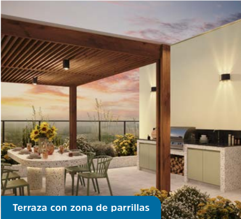
Terraza con zona de parrillas