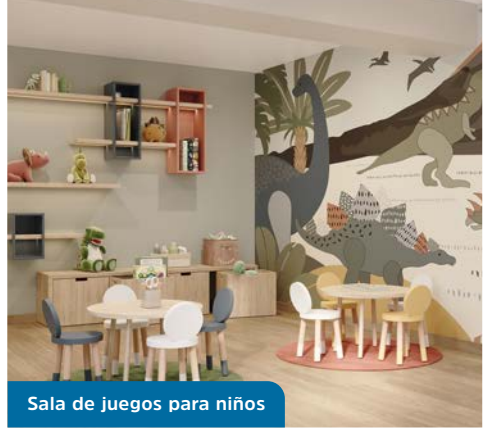
Sala de juegos para niños