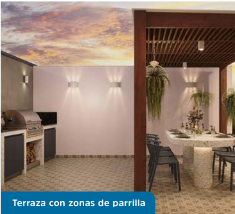
Terraza con zonas de parrilla